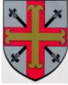
Commune de Waldbredimus