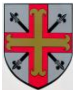
Commune de Waldbredimus