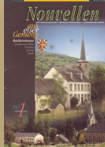
Die 1. Ausgabe der Nouvelles im Jahr 2000