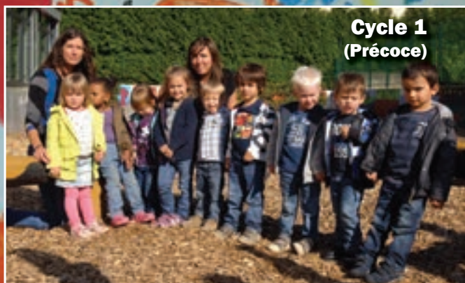
Cycle 1 (Précoc)