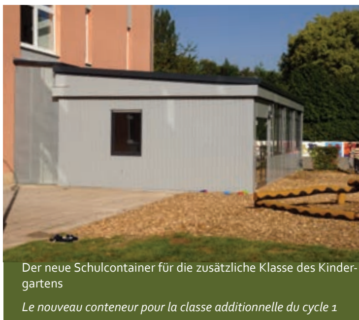
Der neue Schulcontainer für die zusätzliche Klasse des Kindergartens

En séance à huis clos, l'ingénieur technicien Mike Scholtes est nommé définitivement avec 6 voix pour et