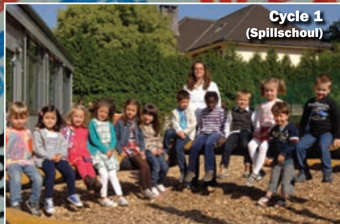
Cycle 1 (Spillschoul)