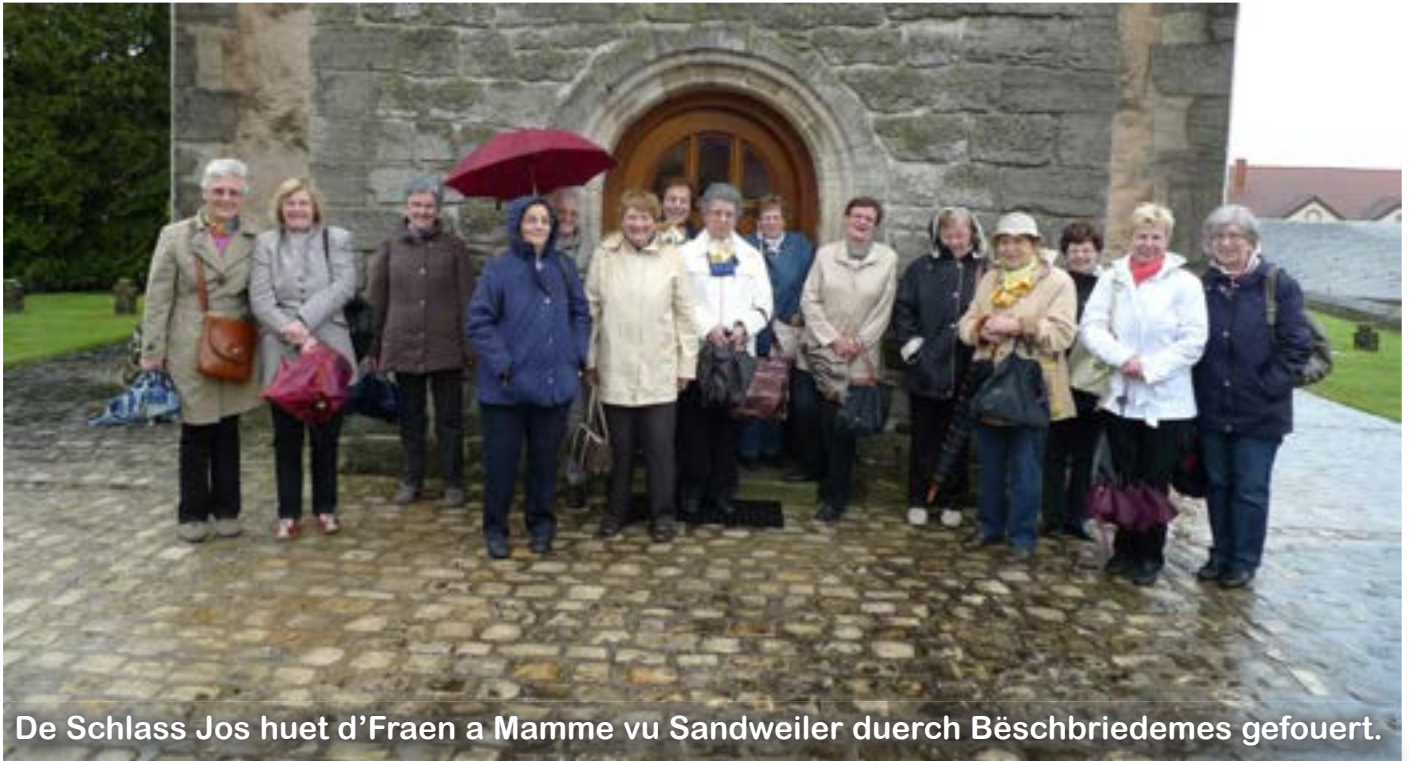
De Schlass Jos huet d'Fraen a Mamme vu Sandweiler duerch Bëschbriedemes gefouert.