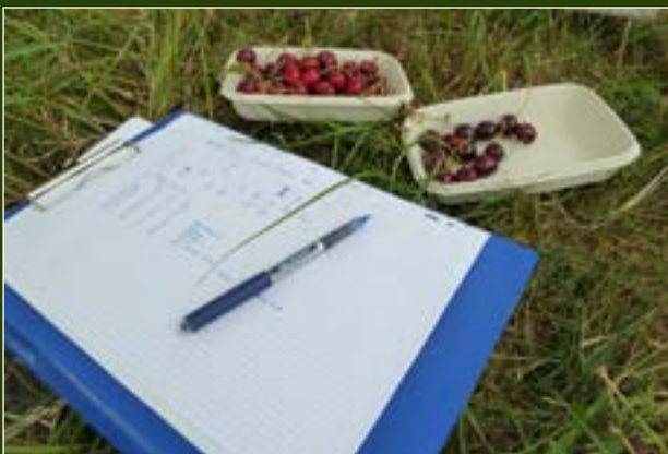
Im Rahmen des Projektes werden spezifische Daten zu den Kirschbäumen und den Sorten erhoben und ausgewertet.