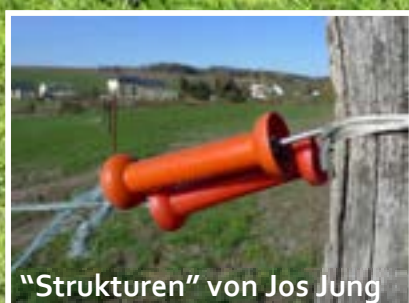
„Strukturen“ von Jos Jung