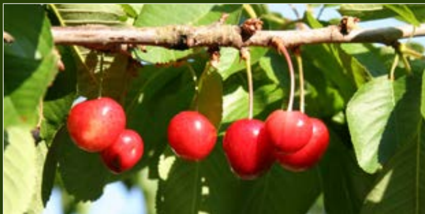
Insgesamt konnten in der Kirschsaison 2011 bereits mehr als 31 verschiedene Kirscharten nachgewiesen werden!

– Fondation Hëllef fir d'Natur" die Bongerten auf die vorhandenen Sorten hin untersucht werden (Sortenkartierung). In einem nächsten Schritt sollen die so entdeckten, seltenen oder regional-typischen Sorten, die heute in keiner Baumschule mehr erhältlich sind, auf junge Bäume veredelt und anschließend wieder in den "Bongerten" gepflanzt werden. Auf diesem Wege werden die Sorten vor dem Aussterben bewahrt und stehen auch kommenden Generationen noch zur Verfügung.