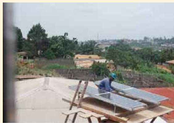
Fixation des modules solaires sur les structures placées sur la plate forme du poteau

Lors des premiers mois de fonctionnement, les responsables ont quand-même remarqué le problème du manque de soleil, lors des mois de pluie.