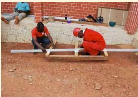
Montage des structures pour modules solaires