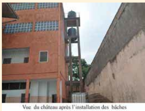
Vue du château après l'installation des bâches