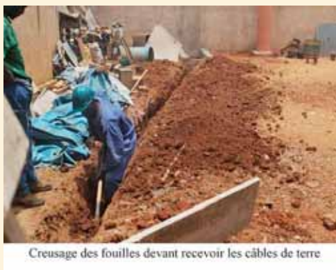
Creusage des fouilles devant recevoir les câbles de terre