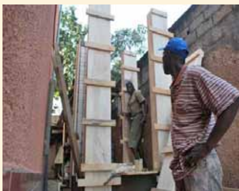
poteaux coffrés et coulés

Par les photos vous pouvez suivre les travaux réalisés sur place