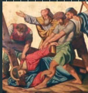
Opléisung vun der leschte Kéier: Detail aus dem Messgewand Kierch Waldbriedemes