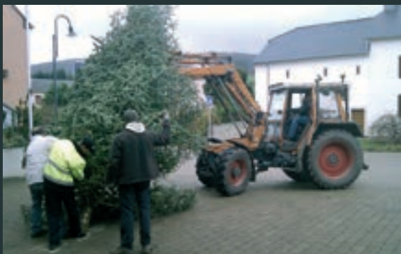
25.11.2010 De Crëschtbeemchen gëtt opgeriicht