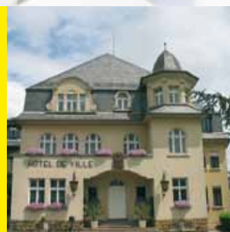
Hôtel de Ville REMICH Place de la Résistance L-5501 Remich

Nutzen Sie dieses Angebot und besuchen Sie den Energieberater; gerne auch in Begleitung Ihres Architekten oder Bauträgers. Es erwartet Sie eine kompetente und individuelle Beratung zu allen Fragen aus dem Bereich Energie. Die Beratung ist kostenlos. Um lange Wartezeiten zu vermeiden empfiehlt sich eine Terminvereinbarung.