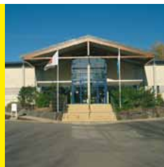
Centre Sportif "ROLL DELLES" Avenue des Villes Jumelées L-5612 Mondirf-les-Bains