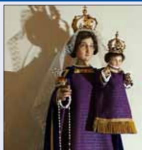
D'Fraen a Mammen vun Trënteng hun e neit Kleed fir d'Muttergottesstatu kaft.