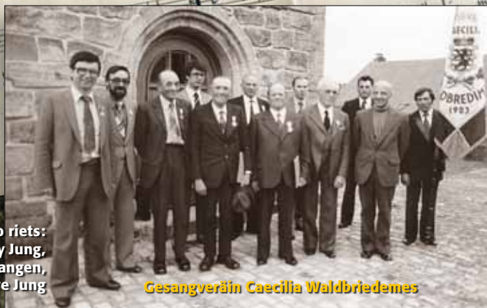
Gesangveräin Caecilia Waldbriedemes