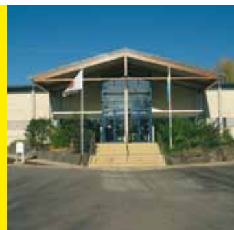
Centre Sportif "ROLL DELLES" Avenue des Villes Jumelées L-5612 Mondirf-les-Bains