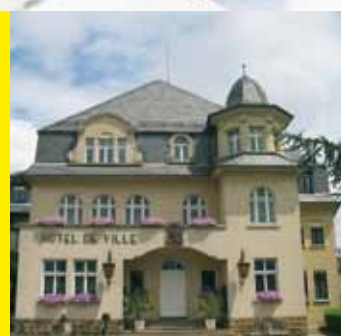
Hôtel de Ville REMICH Place de la Résistance L-5501 Remich

Nutzen Sie dieses Angebot und besuchen Sie den Energieberater; gerne auch in Begleitung Ihres Architekten oder Bauträger. Es erwartet Sie eine kompetente und individuelle Beratung zu allen Fragen aus dem Bereich Energie. Die Beratung ist kostenlos. Um lange Wartezeiten zu vermeiden empfiehlt sich eine Terminvereinbarung.